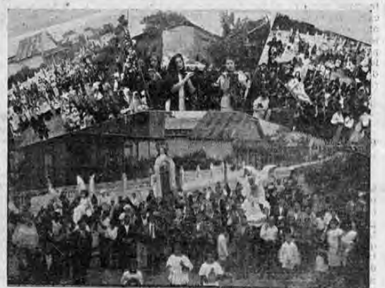
Recoge el grabado diversos aspectos de la procesión verificada el domingo último en Aranjuez en honor de Santa Teresita del Niño Jesús, con motivo de celebrarse la fiesta patronal. Tanto los festejos religiosos como los demás, estuvieron muy concurridos.