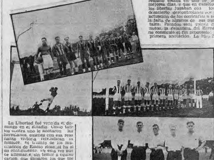
La Libertad fue vencida el domingo en el Estadio. Cinco tantos contra uno le anotaron los heredianos, quienes con esa resonante victoria reivindicaron su nombre. El triunfo de los jugadores de Estadio Rosal ha sido contundente. De esta vez que se afirman, sin temor a equivocación, que ganaron los que mejor jugaron, los que con su actuación en ese encuentro, han probado que el Herediano es el potente equipo de siempre. La victoria adquiere más importancia si se toma en cuenta que ha sido obtenida contra el equipo de más fama en el campeonato de fútbol de las divisiones de fútbol de la ciudad. Para el herediano el resultado de ese partido era decisivo no por el hecho de los dos puntos, que de nada le sirven sino para mantener sus prestigios, para reponerse de anteriores desastres. Y en cuanto a la Libertad el empate estaba en mantenerse invictos. Así las cosas el encuentro tenía que resultar como resultado: muy interesante y presenciado por numeroso público. Pero ese interés se circunscribió a la destacada actuación del campeón nacional, que volvió a su lucido juego de combinación, a ese juego de salón que lo ha hecho famoso. Los libertos estuvieron desastrosos, incoherentes, te que debido a la falta de tres de sus puntales: Trejos en la defensa y Lalo Rojas y Macho Madrazal en la delantera. Los tres estaban enfermos y no podían actuar. Fueron suplidos por elementos de segunda pero con tanto desacierto que esos elementos nuevos fueron colocados en la misma ala, debilitándola notablemente. Y tal interacción se dio para luchar contra un equipo que como el Herediano llevaba dispuesto a triunfar. A estas circunstancias se debió que el score fuera tan elevado. Porau

Tres tantos en el primer tiempo y dos en el segundo.— La Libertad anotó el suyo cuando el Herediano llevaba dos a su favor.— Como se desarrolló el partido que culminó con la victoria de los que hicieron perder a La Libertad el título de invicta